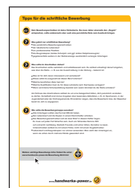
Tipps für die schriftliche Bewerbung