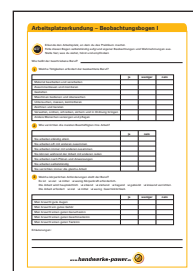
Arbeitsplatzerkundung – Beobachtungsbogen I – III