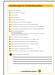
Verhaltensregeln für das Betriebspraktikum