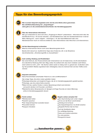
Tipps für das Bewerbungsgespräch